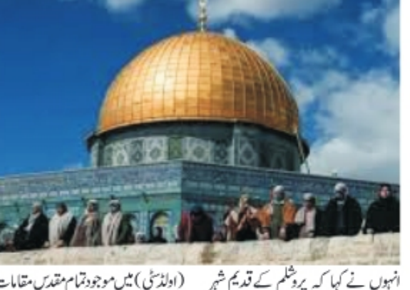
انہوں نے کہا کہ یہ عظیم الشان مسجد اقصیٰ (القدس) میں موجود تمام مقدس مقامات