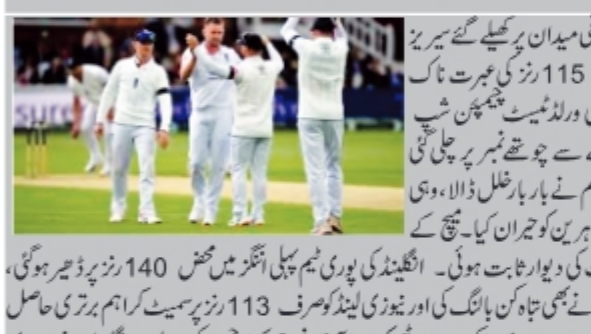
لندن، 8 جون (ایجنزی) لاڈز کے تاریخی میدان پر کھیلے گئے سیریز کے پہلے ٹیسٹ میچ میں انگلینڈ کے ہاتھوں 115 رنز کی عبرت ناک شکست کے بعد نیوزی لینڈ کی ٹیم آئی سی وی ورلڈ ٹیسٹ چیمپئن شپ 2025-27 کے پوائنٹس ٹیبل پر دوسرے سے چوتھے نمبر پر چلی گئی ہے۔ بارش سے متاثر اس میچ میں جہاں موسم نے بار بار ٹھنڈ ڈالا، وہی لاڈز کی میچ پر غیر مساوی اچھال نے بھی ماہرین کو حیران کیا۔ میچ کے دوران دونوں ٹیموں کی بیٹنگ لائن اپ ریت کی دیوار ثابت ہوئی۔ انگلینڈ کی پوری ٹیم پہلی اننگز میں محض 140 رنز پر ڈھیر ہو گئی، لیکن برف کا پچھا کرتے ہوئے اننگز میں تیسرا ٹیڈ ٹیم کی اور نیوزی لینڈ کو صرف 113 رنز پر سیت کر اہم برتری حاصل کر لی۔ انگلینڈ کے اوپنر ایلیو نے شام 57 رنز بنا کر میزبان ٹیم کو اچھا آغاز فراہم کیا، جس کی بدولت انگلینڈ نے دوسری اننگز میں 226 رنز بنائے۔ کوئی بے بازوں کی جدوجہد اور آخری میچ جاری رہی۔ چوتھے دن کا آغاز 55 رنز پر 5 کھلاڑی آؤٹ سے کرنے والی نیوزی لینڈ کی ٹیم محض 138 رنز پر ڈھیر ہو گئی۔ لیگن ٹیسٹ نے 44 رنز کی ناٹ آؤٹ مزاحمت اٹھائی لیکن وہ ٹیم شکست سے بچ سکا۔ انگلینڈ کی اس فتح کے اصل ہیرو تیز باؤلر ایڈن رابنسن رہے، جنہوں نے پہلی اننگز میں 5 وکٹیں حاصل کرنے کے بعد دوسری اننگز میں بے سے بھی تین میچ 29 رنز بنائے اور پھر باؤلنگ میں 38 رنز دے کر 2 کھلاڑیوں کو آؤٹ کیا۔ لیکن ٹیسٹ میچوں کی سیریز کا پہلا میچ جیتنے کے باوجود انگلینڈ کی ٹیم پوائنٹس ٹیبل پر کوئی بڑی چھلانگ نہیں لگا سکی۔ اب تک کھیلے گئے 11 میچوں میں 4 فتوحات کے ساتھ انگلینڈ ٹیم پوائنٹس ٹیبل پر سرتاویں نمبر پر موجود ہے۔ لیگ ٹیسٹ ٹاپ 2- سے باہر ہو کر اب 4 میچوں میں 58.33 فیصد نمبرز کے ساتھ چوتھے نمبر پر چلی گئی ہے۔ لیگ ٹیسٹ ٹاپ 4 میں پچھلے نمبر پر راج کر رہے ہیں، جنہوں نے اپنے 8 میچوں میں سے 7 میں شاندار فتوحات حاصل کر رکھی ہیں۔