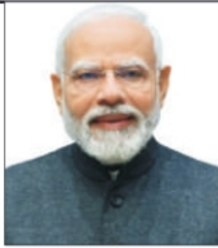
قائدکار وزیر اعظم نریندر مودی

دنیا نے بہت جنگیں دیکھی ہیں۔ اب وقت ہے کہ امن کو ایک حقیقت بنایا جائے۔ ایران اور امریکہ کی جانب سے اٹھایا گیا قدم تاریخ کا مثبت موڑ بن سکتا ہے بس شرط یہ ہے کہ عالمی برادری یکجا ہو کر اس امن کے بیج کو پروان چڑھائے، ورنہ کسی بھی قسم کی بے احتیاطی یا عدم توجہی پوری دنیا کو ایک اور بڑے بحران کی طرف دھکیل سکتی ہے۔ امن کا موقع بار بار نہیں ملتا اس بار اسے مضبوطی سے تھام لینا ہوگا۔