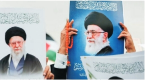
فروری کو تہران میں اگلے دفتر میں شہید گئے۔ یاد رہے کہ آیت اللہ خامنہ ای کو 28 کروڑ یا قریب کروڑ سال قبل پیدا کیا گیا تھا۔

تہران (اے آفاق)۔ آیت اللہ خامنہ ای کے چہلم پر ملک بھر میں تعزیتی تقاریب کا اعلان کیا گیا ہے۔ آیت اللہ خامنہ ای کی شہادت کے 40 دن ہونے کے سلسلے میں تعزیتی اجتماعات اور دعاؤں کا سلسلہ 8 اپریل سے شروع کیا جائے گا۔ آیت اللہ خامنہ ای کی شہادت کے 40 دن ہونے کے سلسلے میں تعزیتی اجتماعات اور دعاؤں کا سلسلہ 8 اپریل سے شروع کیا جائے گا۔ آیت اللہ خامنہ ای کی شہادت کے 40 دن ہونے کے سلسلے میں تعزیتی اجتماعات اور دعاؤں کا سلسلہ 8 اپریل سے شروع کیا جائے گا۔