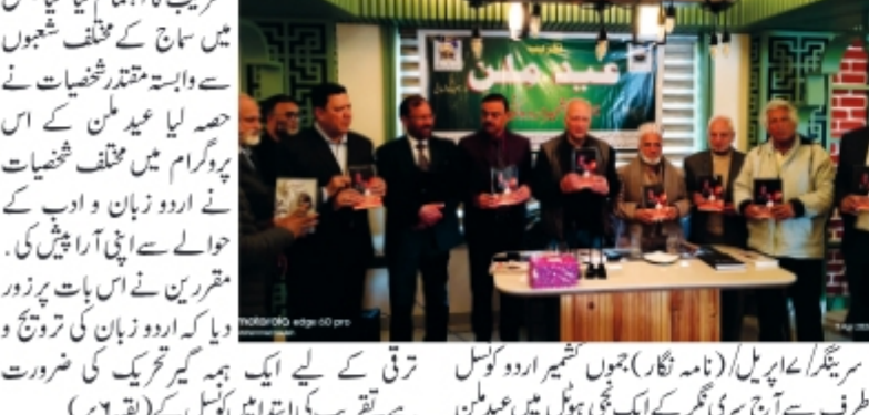
سرینگر/عہدہ پریل/ (نام لگان) جموں کشمیر اردو کونسل طرف سے آج سری گمر کے ایک نجی ہوٹل میں عید ملن