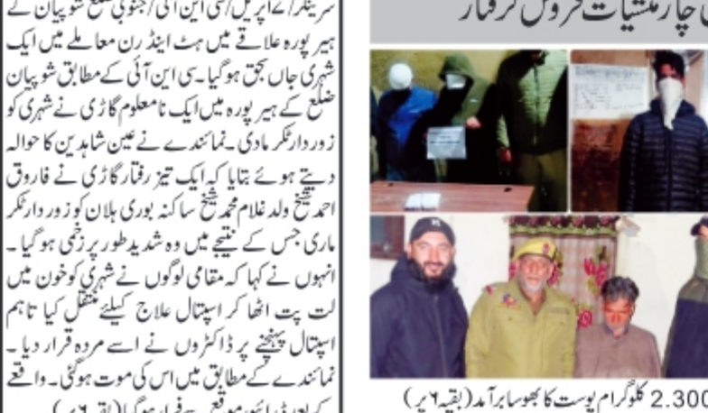
سرینگر/عہدہ پریل/ (آفاق نیوز) منشیات کے خلاف اپنی مسلسل مہم کو جاری رکھتے ہوئے پولیس نے پیلو امہ، بارہمولہ اور سو پور میں چار منشیات فروشوں کو گرفتار کیا ہے اور ان کے قبضے سے منومہ ڈیوکان برآمد کی ہیں۔ پیلو امہ میں پولیس نے چھوٹا کن، جو بیٹا، ڈاکٹر اور اسکول ٹیچر، لار میں سینئر پولیس افسران، نیکی مہرا، اور طلبہ کی بڑی تعداد کی پرورش شرکت کی موجودگی میں منعقد ہوئی۔ سیشن کے دوران، پولیس افسران نے (بقیہ ۶ پر)