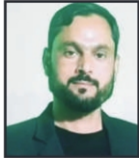
تحریر: اظہار نصیر

اسلام ایک مکمل ضابطہ حیات ہے۔ یہ نہ صرف عبادت تک محدود نہیں بلکہ انسان کے ہر عمل کو رہنمائی دیتا ہے۔ اسلام کا ایک بنیادی اصول خدمتِ خلق ہے۔ اس کا مطلب ہے اللہ کی مخلوق کے ساتھ بھلائی کرنا، ان کے دکھ درد کو دیکھنا، اور اپنی استطاعت کے مطابق ان کی مدد کرنا۔ یہی وہ جذبہ ہے جو ایک معاشرے کو مضبوط اور باوقار بناتا ہے۔ قرآن مجید میں بار بار اس بات پر زور دیا گیا ہے کہ انسان دوسروں کے ساتھ حسن سلوک اختیار کرے۔ اللہ تعالیٰ فرماتا ہے کہ تم اللہ کی عبادت کرو اور اس کے ساتھ کسی کو شریک نہ کرو، اور والدین، رشتہ داروں، یتیموں، مسکینوں، یتیموں اور مسافروں کے ساتھ اچھا سلوک کرو۔ اس آیت میں واضح پیغام ہے کہ عبادت کے ساتھ ساتھ بندوں کے حقوق بھی ادا کرنا ضروری ہے۔