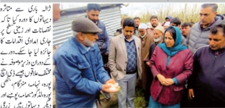
ڈالہ باری سے متاثرہ دیہاتوں کا دورہ کیا تاکہ نقصانات اور زخمی سطح پر جاری امدادی اقدامات کا جائزہ لیا جا سکے۔ دورے کے دوران وزیر موصوف نے مختلف علاقوں جیسے ڈی ایچ پیورہ، نھامہ، منڈگام، پھولہ، لڈگورہ، سہماں، پوہ پوہ اور دیگر دیہاتوں میں زخمی فصلوں، باغات، رہائشی مکانات اور عوامی ڈھانچے کو دیکھنے والے نقصانات کا موقعہ پر جائزہ لیا۔ (بقیہ ۶ پر)