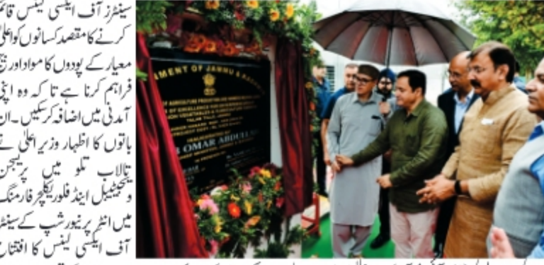
جموں/عہدہ پریل/ (ڈی آئی پی آر) وزیر اعلیٰ مسز عمر عبداللہ نے آج زور دیا کہ زراعت اور اس سے متعلق شعبوں میں