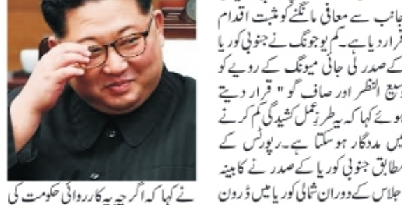
جوڈی کوریائی صدر کے اقدام کی تعریف

جوڈی کوریائی صدر کے اقدام کی تعریف درازا کے معاملے پر بات کرتے ہوئے معذرت کا اظہار کیا تھا۔ انہوں نے جوڈی کوریائی صدر کے اقدام کی تعریف کی ہے۔ انہوں نے کہا کہ اگرچہ یہ کارروائی حکومت کی جانب سے نہیں گئی، تاہم غیر ذمہ دارانہ اقدامات سے پیدا ہونے والی غیر ضروری فوجی کشیدگی پر وہ معافی چاہتے ہیں۔ جوڈی کوریائی صدر نے حالیہ دنوں ستمبر سے جوڈی کے درمیان سمینڈ ڈرون دراندازی کے الزام میں تین افراد پر فرد جرم بھی عائد کیا ہے۔ شمالی کوریا کی سرکاری خبر رساں ایجنسی کوریین سینٹرل نیوز ایجنسی کے مطابق کم پو جوڈی نے اس پیش رفت کو واہمنہ قرار دیتے ہوئے کہا کہ کم پو جوڈی ان بھی اسے ایک مثبت اور حقیقت پسندانہ رویہ سمجھتے ہیں۔ یہ پیش رفت ایسے وقت میں سامنے آئی ہے جب دونوں کوریاؤں کے درمیان تعلقات میں اتار چڑھاؤ جاری ہے اور معمولی واقعات بھی کشیدگی میں اضافے کا باعث بن سکتے ہیں۔