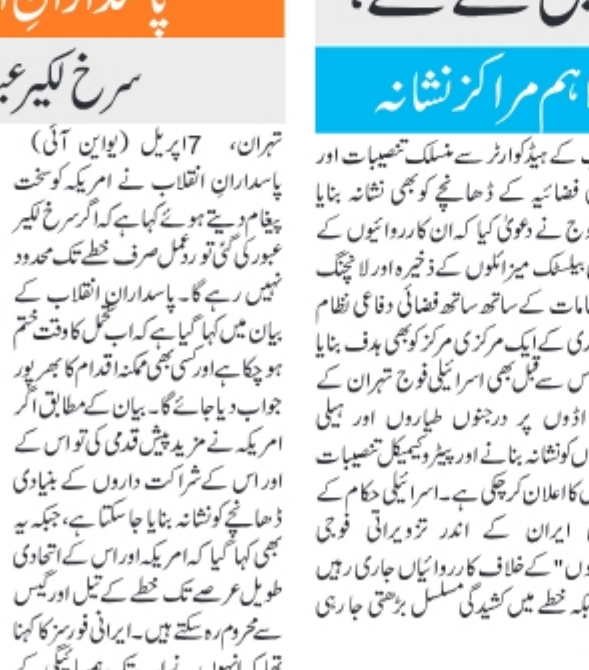
اسرائیل کے تہران میں نئے حملے، پاسداران انقلاب کے اہم مراکز نشانہ