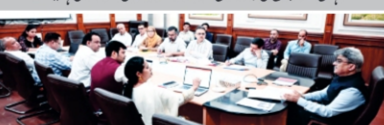
جموں/عہدہ پریل/ (ڈی آئی پی آر) چیف سیکریٹری اعلیٰ ڈیو نے ہاؤسنگ و اینڈ ڈیولپمنٹ ڈیپارٹمنٹ (ایچ ڈی ڈی) کی میٹنگ کی صدارت کی جس میں جموں و کشمیر کے شہری علاقوں میں بنیادی ڈھانچے کو بہتر بنانے، روزگار کے مواقع پیدا کرنے، صفائی کو یقینی بنانے اور معیار زندگی میں

بہتری لانے کے لئے جاری اہم سکیموں کی پیش رفت کا جائزہ لیا گیا۔ میٹنگ میں سیکریٹری ایچ ڈی ڈی، جموں و کشمیر گورنمنٹ (جے ایم جی ایس ایم سی) کے چیف سیکریٹری، ڈپٹی سیکریٹری (ایچ ڈی ڈی) اور دیگر اہل ذمہ داروں نے شرکت کی۔ (بقیہ ۶ پر)