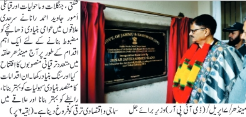
مینڈھر/عہدہ پریل/ (ڈی آئی پی آر) وزیر برائے جل