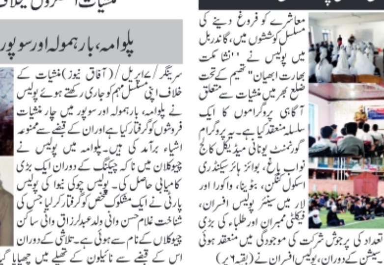
سرینگر/عہدہ پریل/ (آفاق نیوز) منشیات کی لغت سے لڑنے اور ایک صحت مند اور منشیات سے پاک