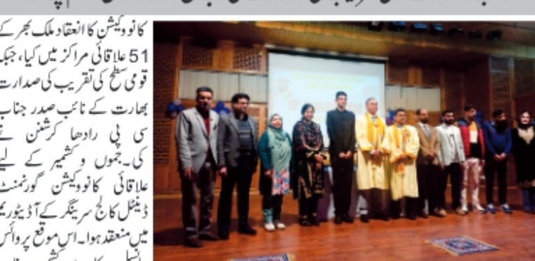
سرینگر/عہدہ پریل/ (پی آئی پی آر) اندرا گاندھی انسٹیٹیوٹ آف یونیورسٹی (آئی جی این او) نے آج اپنے 39 ویں