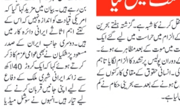
بحرین نے ایران کے لیے جاسوسی کے الزام میں دو افراد کو حراست میں لیا