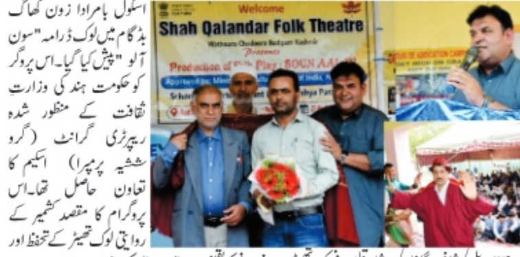
بڈشاہ کچل انسٹی ٹیوٹ نے وزارت ثقافت حکومت ہند کے تعاون سے کیا تھا تقریب کا اہتمام کیا گیا۔ تقریب میں بڈشاہ کچل انسٹی ٹیوٹ کے طلبہ نے اپنی فنکاریاں پیش کیں۔ (بقیہ ۶ پ)