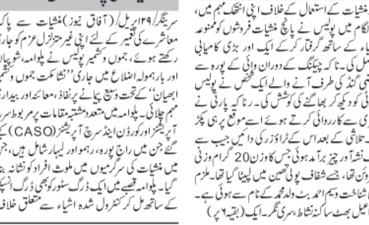
سرینگر/۱۹ اپریل (آفاق نیوز) منشیات کی اسکالنگ اور منشیات کے استعمال کے خلاف اپنی انتھک مہم میں، پولیس نے جنوبی کشمیر میں 7 منشیات فروشوں کو گرفتار کیا۔ انہوں نے بھاری مقدار میں ممنوعہ اشیاء برآمد کیں۔ (بقیہ ۶ پ)