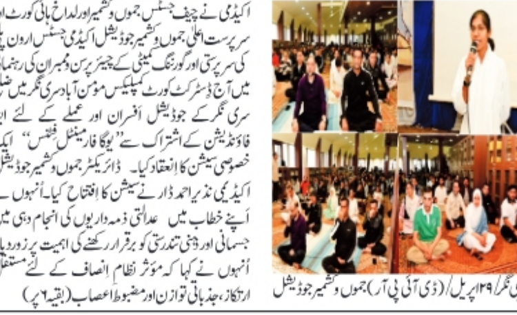
سرینگر/۱۹ اپریل (ڈی آئی پی آر ڈویژن) جموں و کشمیر جوڈیشل اکیڈمی نے، جموں و کشمیر جوڈیشل اکیڈمی میں، ڈی ایچ جی، ایف آئی ڈی اور ڈی ایچ جی کے زیر اہتمام، "یوگا فار میٹلس" پر خصوصی سیشن کا انعقاد کیا۔ سیشن میں شرکاء کو جسمانی اور ذہنی تندرستی کو برقرار رکھنے کی اہمیت پر زور دیا گیا۔ سیشن کے اختتام پر، شرکاء کو مختلف ورزشوں اور یوگا کے فوائد کے بارے میں معلومات دی گئیں۔ (بقیہ ۶ پ)