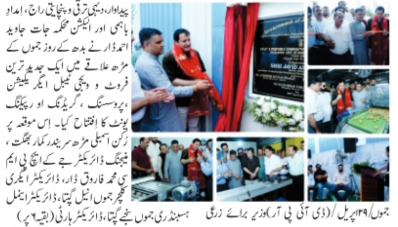
جموں/۱۹ اپریل (ڈی آئی پی آر ڈویژن برائے زرعی سہولتوں کی جموں شعبے نے، ڈائریکٹر ہارنی (بقیہ ۶ پ)