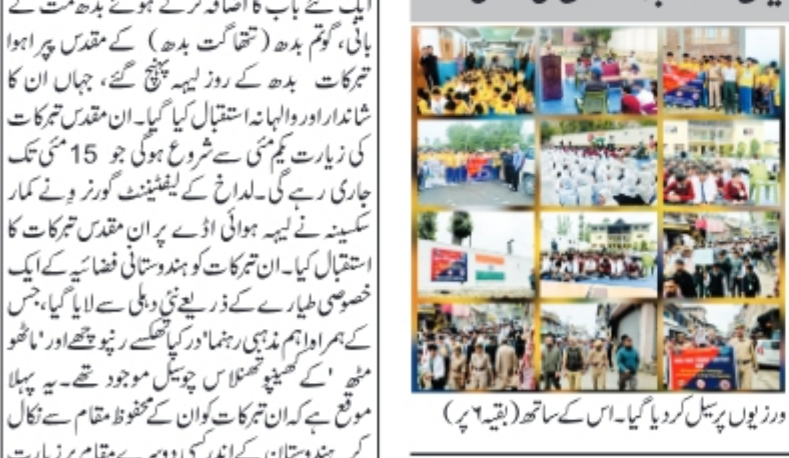
سرینگر/۱۹ اپریل (آفاق نیوز) نشاطت بے اینڈ کے تحت، مختلف اضلاع میں مہم جاری ہے۔ اس مہم کے تحت، لوگوں کو بے روزگاری سے نمٹنے کے لیے مختلف اقدامات کی ترغیب دی گئی ہے۔ (بقیہ ۶ پ)