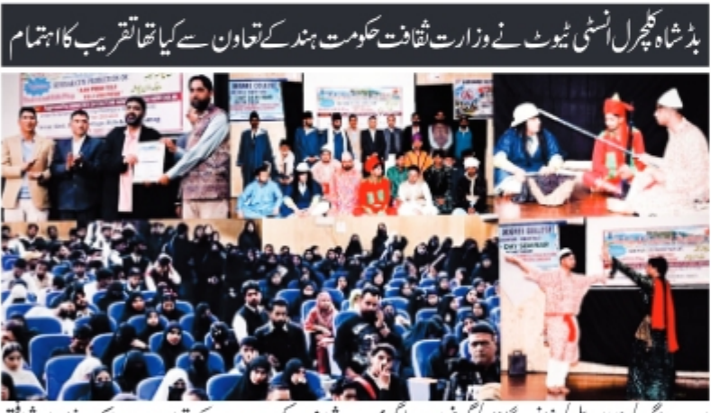
بڈشاہ کچل انسٹی ٹیوٹ نے وزارت ثقافت حکومت ہند کے تعاون سے کیا تھا تقریب کا اہتمام کیا گیا۔ تقریب میں بڈشاہ کچل انسٹی ٹیوٹ کے طلبہ نے اپنی فنکاریاں پیش کیں۔ (بقیہ ۶ پ)