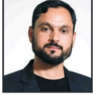
تحریر: طاہر نصیر

یہ عریضی اور سنسور نے کی ہوتی ہے۔ یہی وقت ہوتا ہے جب ایک بچہ اپنی شخصیت بنانا ہے اور اپنے مستقبل کی بنیاد رکھتا ہے۔ لیکن اسی عمر میں جب نشہ داخل ہو جائے تو یہ بنیاد کمزور ہو جاتی ہے۔ نشے آسانی سے متاثر ہوتے ہیں اور غلط راستے پر چل پڑتے ہیں۔ اس کا نقصان صرف فرد تک محدود نہیں رہتا بلکہ پورے خاندان اور معاشرے کو متاثر کرتا ہے۔