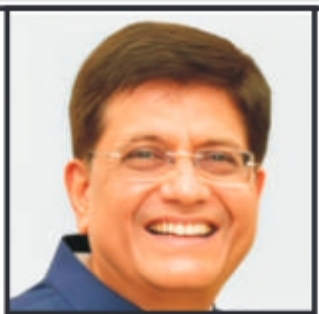
جناب پیش گوئل

گرمیوں کا موسم خوشیوں، تفریح اور یادگار لمحات کا موسم ہونا چاہیے، نہ کہ جنازوں اور ماتم کا۔ اگر ہم واقعی ان قیمتی جانوں کا احترام کرنا چاہتے ہیں جو حالیہ دنوں میں ضائع ہوئیں، تو ہمیں اپنے رویوں میں تبدیلی لانا ہوگی۔ پانی کی خوبصورتی سے لطف ضرور اٹھائیں، لیکن اس کی طاقت کو کبھی کم نہ سمجھیں۔ کیونکہ ایک لمبے کی لا پرواہی، پوری زندگی کا پچھتاوا بن سکتی ہے۔