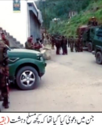
جن میں دوہمی کیا گیا تھا کچھ مسلح دہشت (ایجنسیز)

ڈرونز کے ذریعے علاقے کی نگرانی کی جا رہی ہے