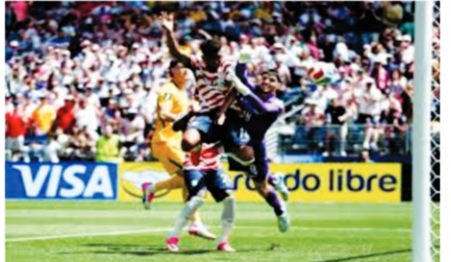
سینٹرل، 20 جون (ایجنڈا) امریکہ کی فٹ بال ٹیم نے فیفا ورلڈ کپ 2026 میں جھ کے روز آسٹریلیا کو 2-0 سے شکست دے کر ناک آؤٹ راونڈ میں جگہ بنا لی اور گروپ