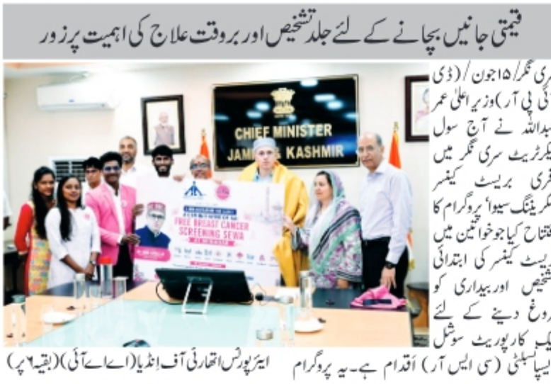
سربراہ (ڈی آئی بی آر) وزیر اعلیٰ عمر عبداللہ نے آج سول سکریننگ سروس میں فزری بریسٹ کینسر سیوا کا افتتاح کیا جو خواتین میں فزری بریسٹ کینسر کی ابتدائی تشخیص اور بیماری کو فروغ دینے کے لئے ایک کارپوریٹ سوشل ریسپانسی (سی ایس آر) اقدام ہے۔ یہ پروگرام ایئر پورٹ اتھارٹی آف انڈیا (اسے آئی) (بقیہ پر)